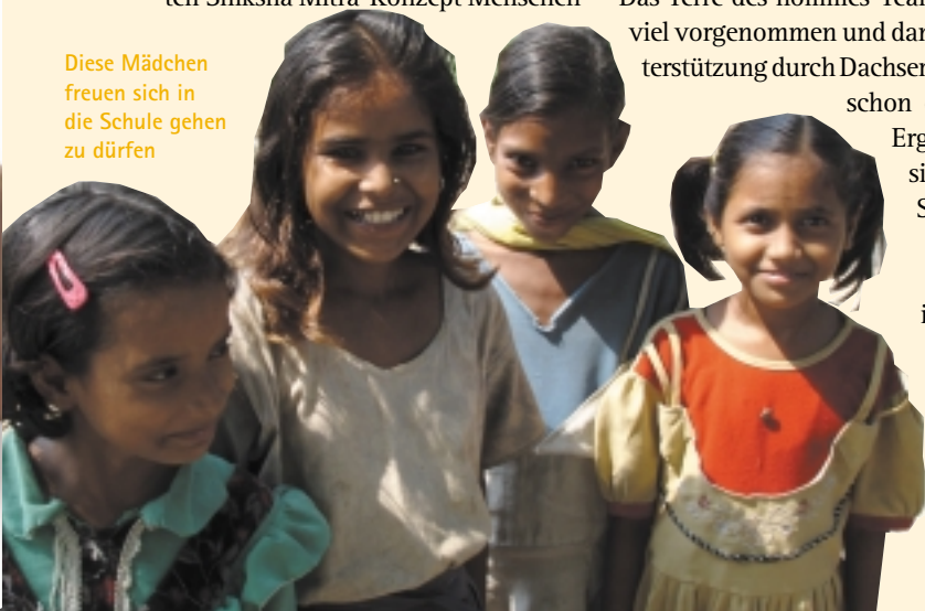
Diese Mädchen freuen sich in die Schule gehen zu dürfen